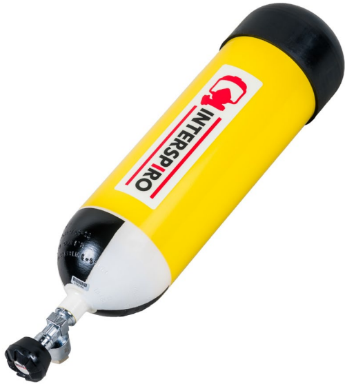
Stahlflasche - 6.0 L