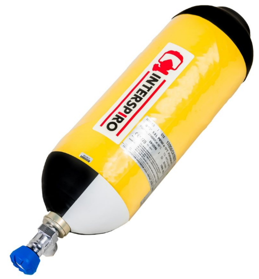
Vollkomposit - 9.0 L