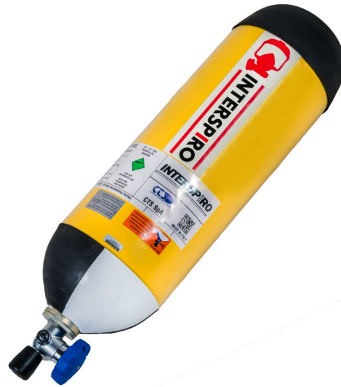
Vollkomposit - 6.8 L